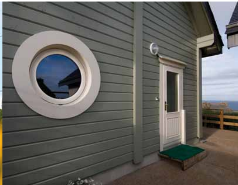
En bois, certes, mais parfaitement intégrée au style breton, la maison se fond dans son voisinage