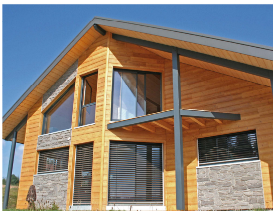
Le guide Construire sa maison écologique en bois de A à Z dans les librairies.