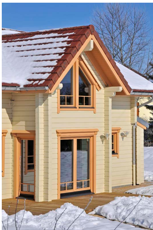
Eco-construction labellisée BBC dans le Jura.

En 2008, Honka a lancé son nouveau concept Honka Fusion™ pour répondre aux performances thermiques les plus exigeantes d'aujourd'hui comme le label BBC et Minergie® en Suisse. La paroi Honka Fusion™ est associée à une isolation naturelle en fibre de bois pour permettre à la maison de respirer. La paroi Honka Fusion™ en 128 mm avec un isolant en fibre de bois permet de répondre à la future réglementation RT2012.