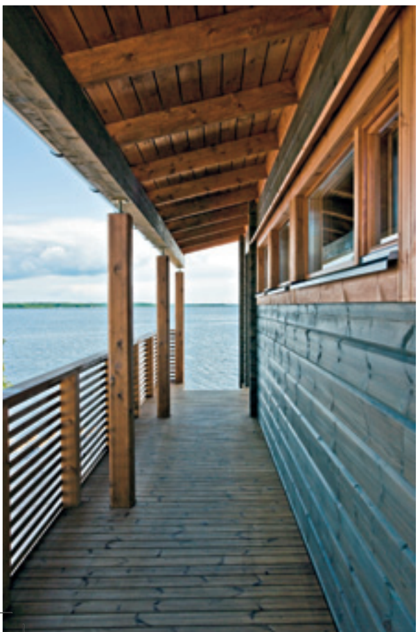
La longue terrasse qui conduit jusqu'au sauna se prolonge également jusqu'à la mer.