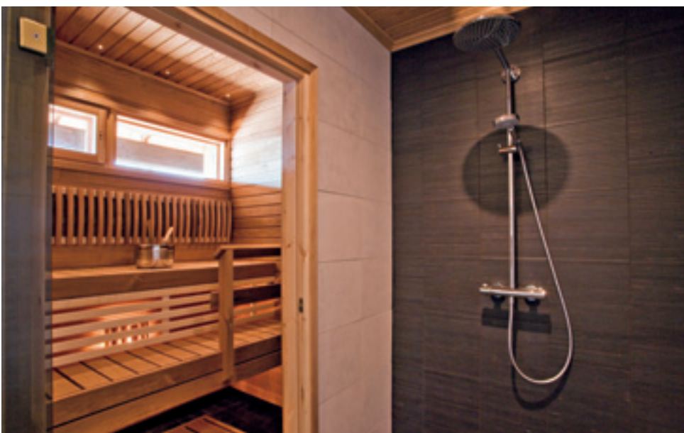
Le plafond est réalisé avec du lambris thermo traité en bouleau. Bancs de sauna en panneaux thermo traités en bouleau.