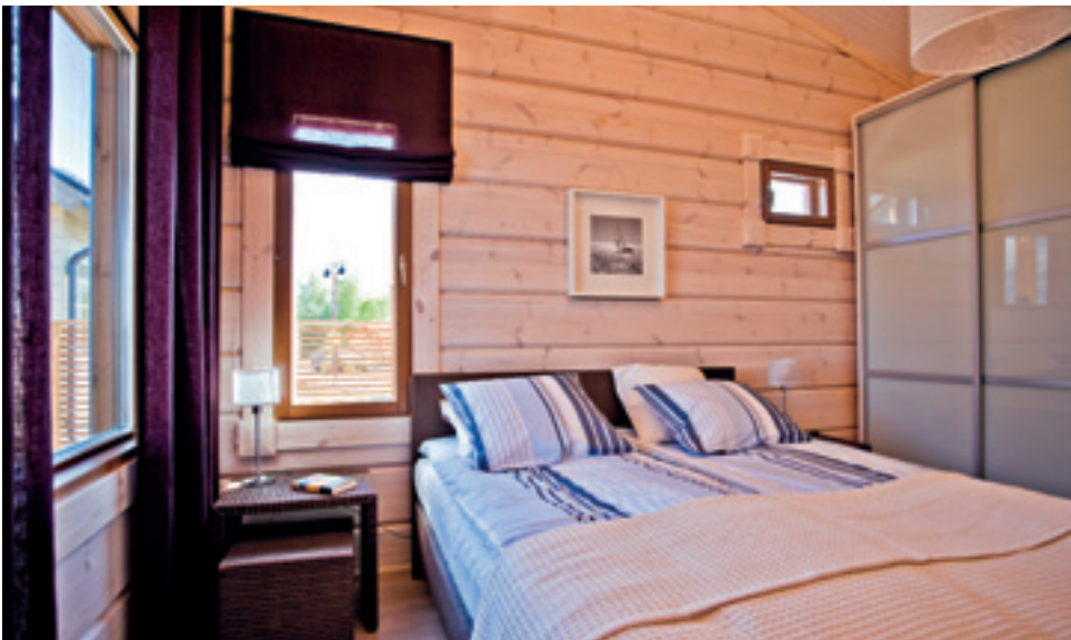
Pas besoin de dimensions extravagantes. Une chambre se doit d'être avant tout confortable et chaleureuse pour nous permettre de profiter des périodes de sommeil ou de repos.